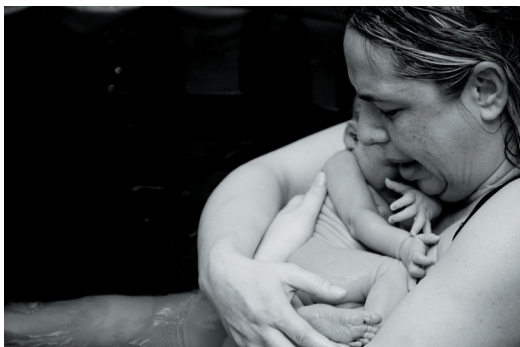
Rojstvo: Prvo srečanje z zunanjim svetom, prvi pogled, prva dobrodošlica.

postale modre ženske, sage femme , kot je neposredno ohranjeno v francoskem poimenovanju babíc –, da bi zadostile temeljnemu pogoju babičevanja?