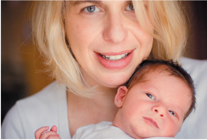
Andro v maminem naročju.