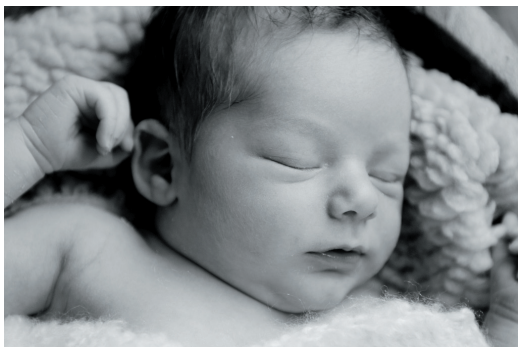
Takoj po rojstvu: Del celote: na prsih, v objemu staršev, v sebi.

govorijo o bogastvu vednosti, na primer o prepoznavanju napredovanja poroda iz načinov dihanja in oglašanja ženske ali rabi voha za ugotavljanje razpoka plodovih ovojev. Nikakor ne bi smeli podcenjevati simbolnih ukrepov, ki so jih babice predlagale v do-